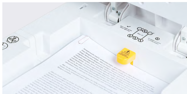
Détruit aussi les documents avec agrafes et trombones.